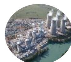
CIFM (Fabrication et maintenance)