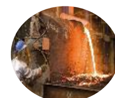
CCPM (Produits métalliques)