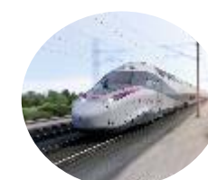
CFCM (Maintenance ferroviaire)